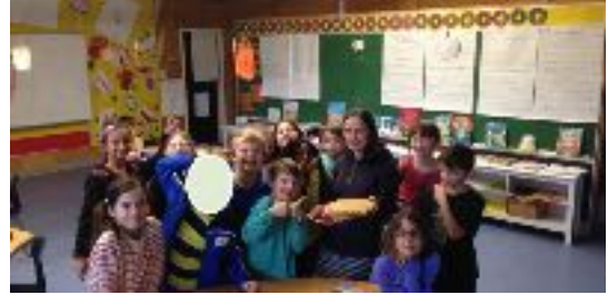
Photo de classe et d'école

66 crêpes ont été confectionnées et toute l'école a pu les déguster avec un très grand plaisir ! Merci pour la belle surprise ....